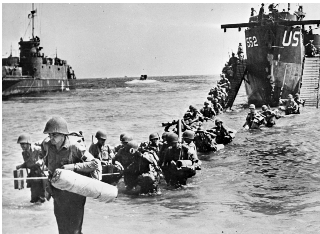
Des troupes débarquant sur les côtes varoises.