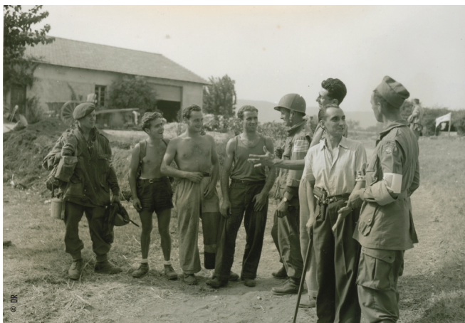
Une discussion impromptue entre un groupe de soldats américains, britanniques et français et des civils français enthousiastes.