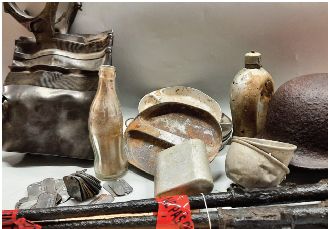
Des vestiges archéologiques du débarquement qu'il faut préserver.