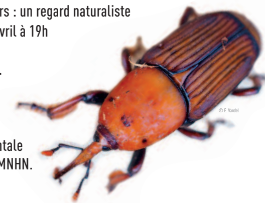
CHARANÇON ROUGE DU PALMIER